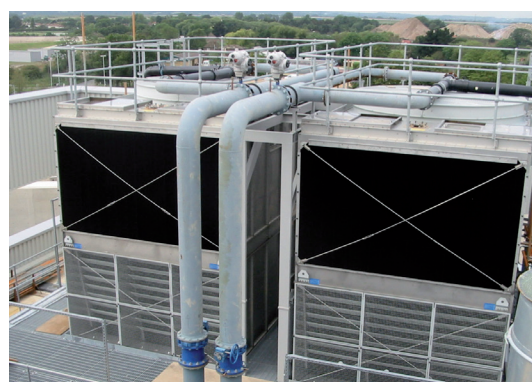
Déflecteurs à 3 fonctions installés en partie supérieure de tours de refroidissement S3000, avec déflecteurs traditionnels en partie inférieure