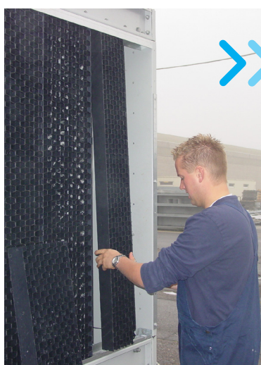
Déflecteurs à 3 fonctions faciles à manipuler